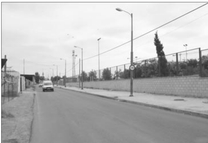
López firmó con el alcalde de Albal el proyecto de les Corregudes.

En virtud de este convenio el Ayuntamiento de Catarroja se comprometía a contribuir a los costes de urbanización con la aportación económica que le correspondiera en la urbanización del Camí de les Corregudes en su término