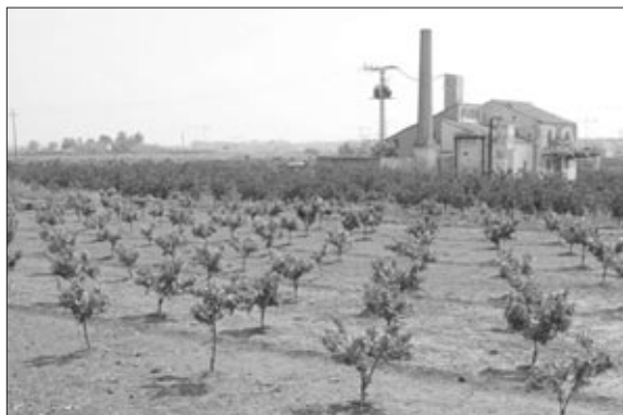
El proyecto destruye patrimonio natural.