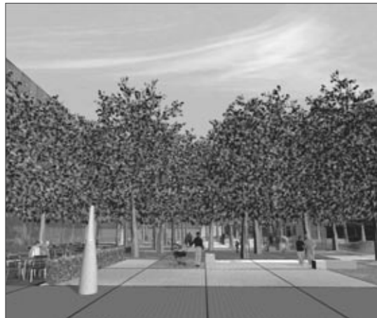
Simulación de la remodelación de la plaza.

Los resultados nos dieron a conocer que el 87,2% creía que era necesario remodelar esta plaza tal y como nos habían expresado algunos colectivos, el 81% que debía ser una plaza ajardinada en la que predominaran los árboles y el 61%