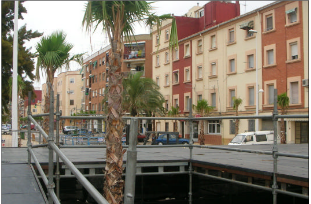
El alcalde ha traspasado todo el problema del ruido a los vecinos de la avenida Rambleta, y además ha cortado al tráfico.

Chirivella, fiel a su más puro estilo, sin mediar palabra, sin hablar con los afectados, decidió unilateralmente quitar todos los actos del centro del pueblo y trasladar el problema a los vecinos de la avenida Rambleta, como si estos estuvieran vacunados contra los ruidos, las molestias y el sueño. Para Chirivella la solución al problema no ha estado, como marca el sentido común, en distribuir los actos por todo el pueblo, sino en trasladarlo a la Rambleta. Allí, aparte de cortar el tráfico durante tres semanas, ha eliminado 200 plazas de