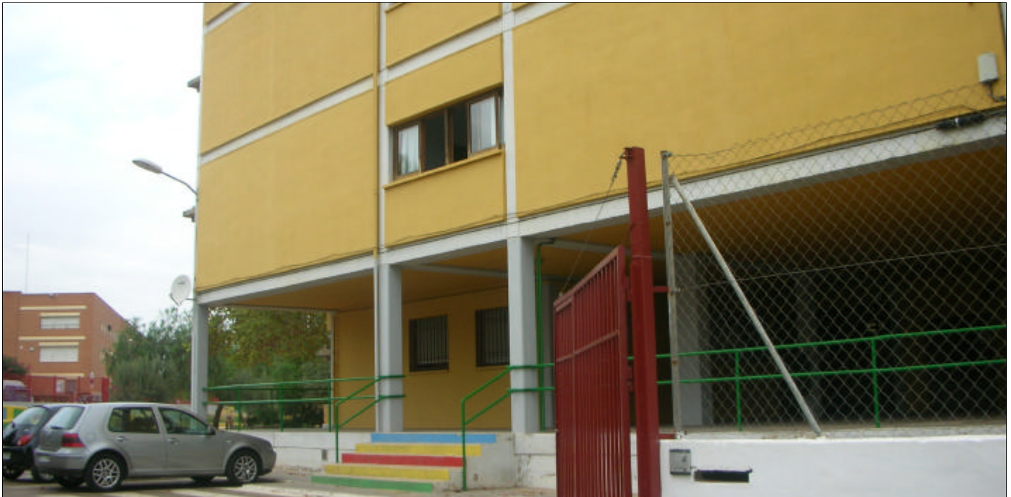
El Colegio Público Jaume I comenzó el curso con una nueva unidad de 3 años sin dotación y va camino de la masificación, con 9 unidades de educación infantil.

La masificación y la imprevisión causan graves problemas en el inicio de curso