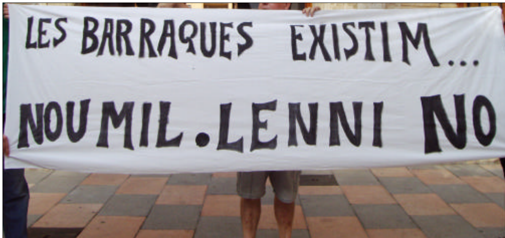
Els veïns i veïnes de l'històric barri de Les Barraques han passat a l'acció, presentant un escrit amb firmes en l'Ajuntament.